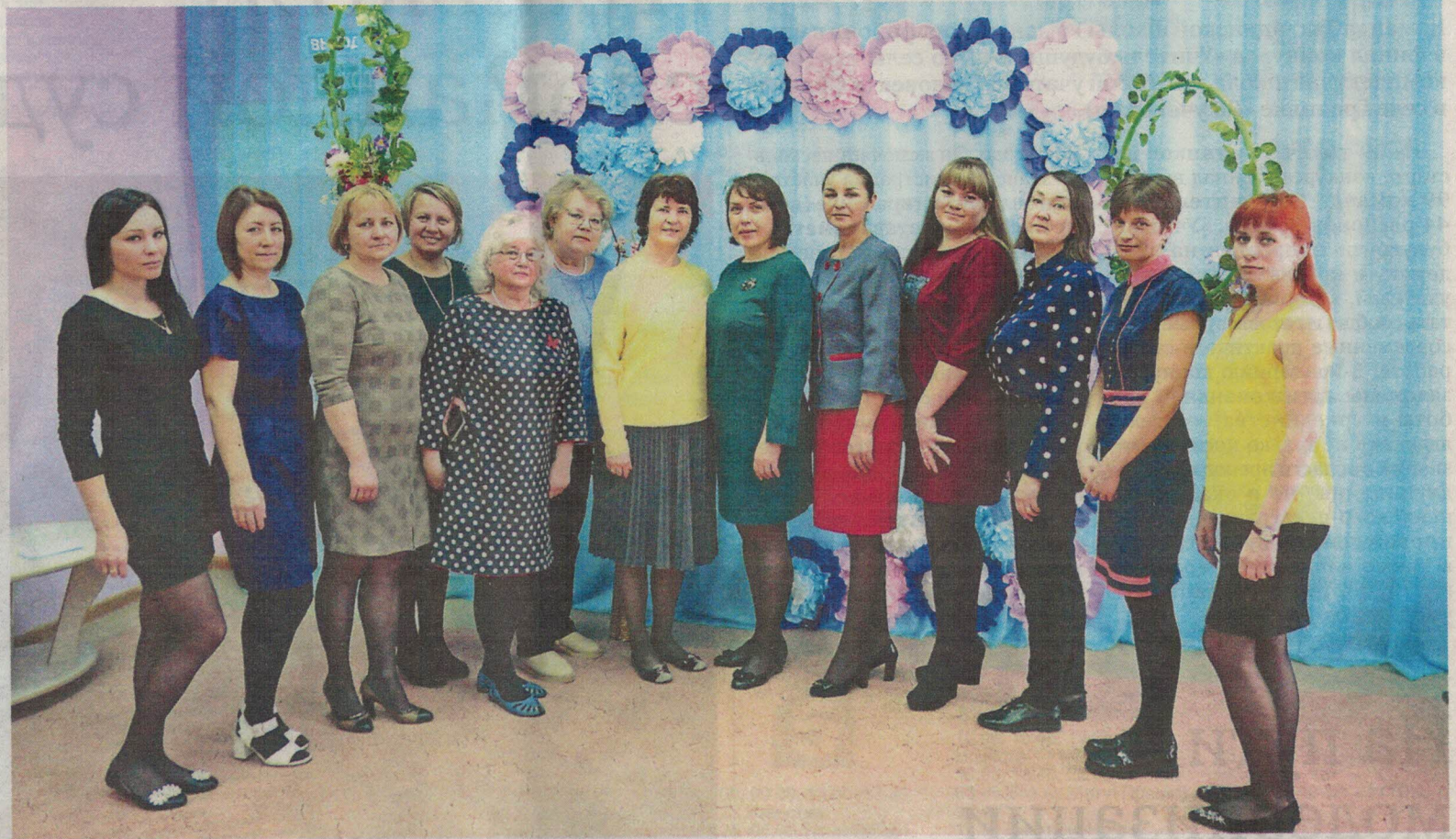
Совместное фото участников семинара на память.