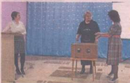
Тренинг «Трогательная коробка» заинтересовал участников встречи.