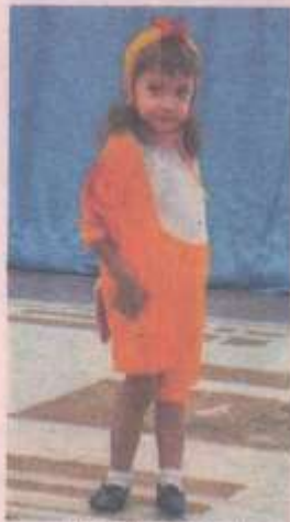
На открытии мероприятия выступили воспитанники детского сада № 15.