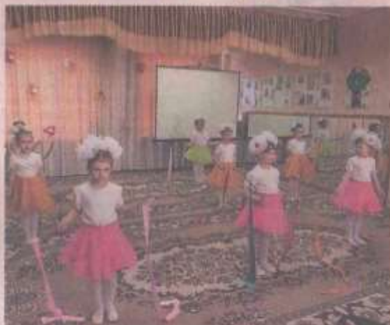
В садике маленькие непоседы никогда не скучают.

Сейчас в городе полным ходом идут ремонт и подготовка образовательных учреждений. Согласно плану работы администрации их приема к 2019 - 2020 учебному году состоится с 12 по 15 августа. Первыми ее пройдут муниципальные детские сады. Некоторые готовятся к приему дошколят после ремонта, а кто-то уже вовсю работает.