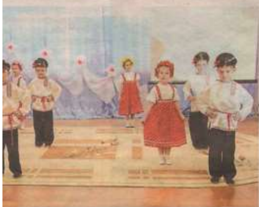
Гостей радовали творческими номерами воспитанники детского сада «Парус».